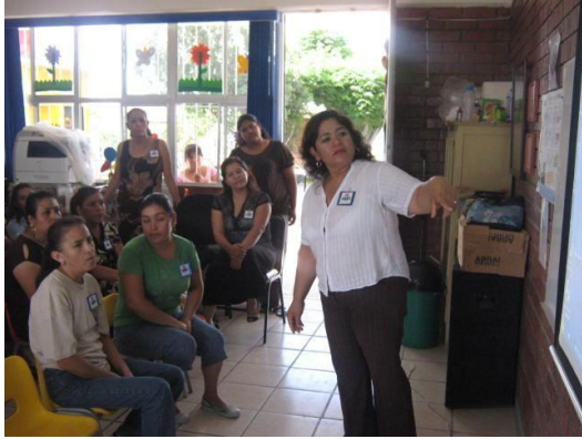
FORO DE RENDICIÓN DE CUENTAS