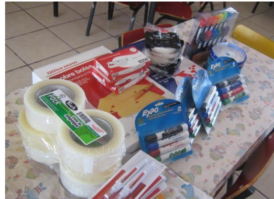
EVIDENCIAS DE ADQUISICIONES