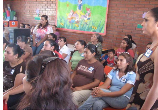
SUPERVISORA EN FORO DE REND. DE CUENTAS