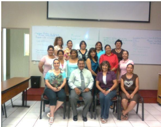
DIRECTORA EN DIPLOMADO SOBRE PART. SOCIAL